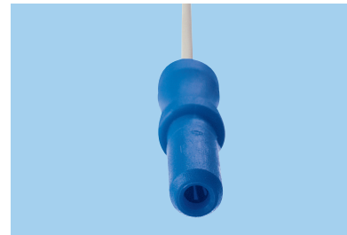
J = connecteur 2 mm