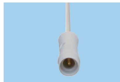
SC = connecteur 0,7 mm